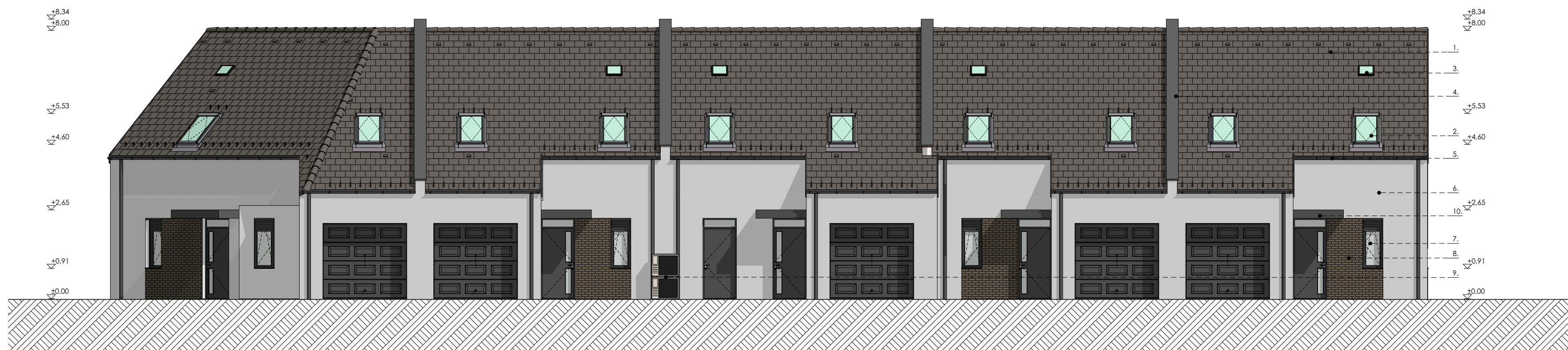
Északnyugati homlokzat (A épület)