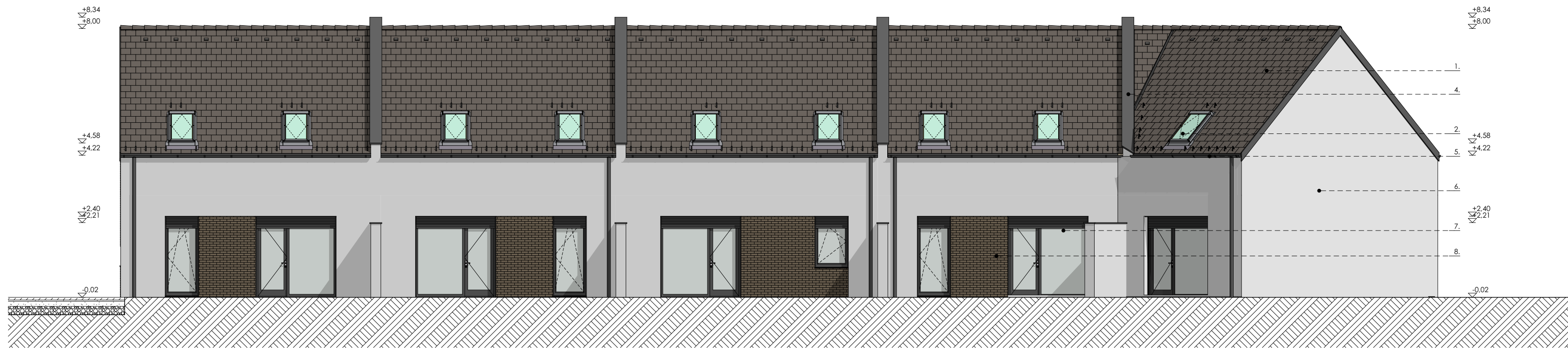
Délkeleti homlokzat (A épület)