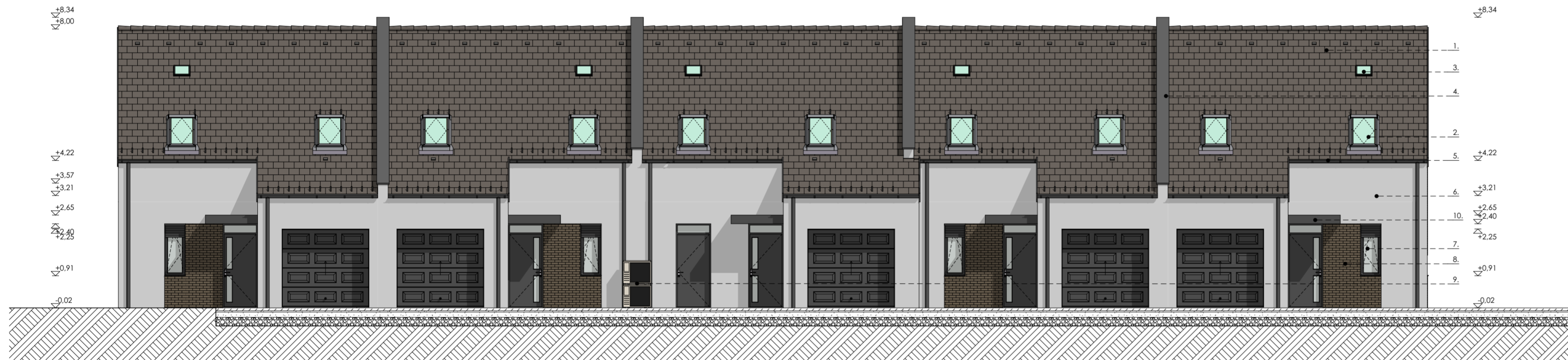
Északkeleti homlokzat (B épület)